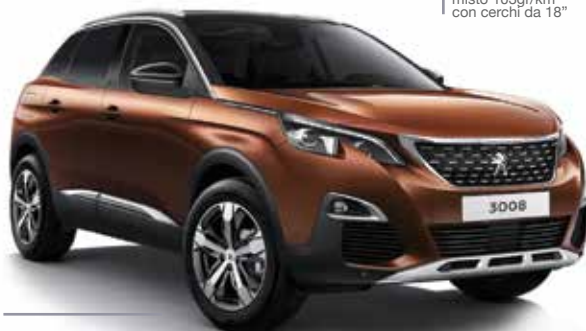
3008 BlueHDI 120S&S Consumo su percorso misto 4,0/4,3. Emissioni di CO2 su percorso misto 104/111gr/km con cerchi da 18" e pneumatici Mud&Snow