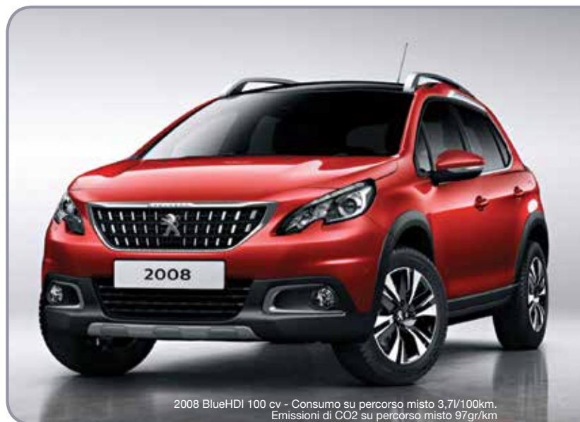
2008 BlueHDI 100 cv - Consumo su percorso misto 3,7/100km. Emissioni di CO2 su percorso misto 97gr/km