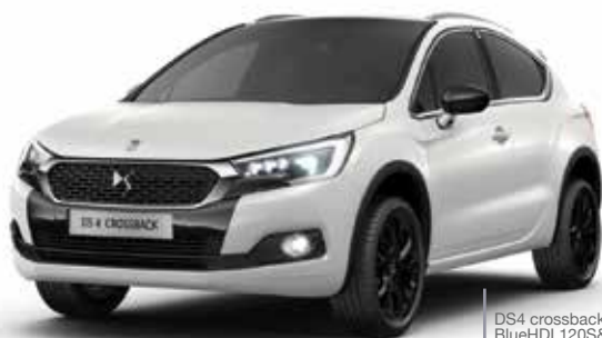
DS4 crossback BlueHDI 120S&S Consumo su percorso misto 3,9/100km. Emissioni di CO2 su percorso misto 103gr/km con cerchi da 18"

ACCOMODATI, SCEGLI E RITIRA IL TUO VEICOLO SENZA PROBLEMI. NOI CI OCCUPIAMO DI TUTTO.