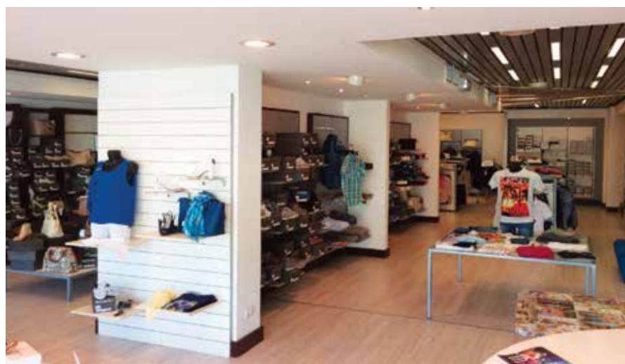
Interno punto vendita di Borgosesia Rondò Parco Carrefour

Z-One S.r.l. è una azienda specializzata nel commercio al dettaglio di calzature ed abbigliamento, proprietaria dal 2009 del marchio "Quattropassi", sinonimo di qualità e convenienza da oltre 20 anni. Nei punti vendita di Borgosesia, Gozzano, Verbania, Casale Corte Cerro e Tortona i nostri clienti potranno trovare una grandissima varietà di calzature, pelletteria ed abbigliamento dei migliori marchi, adatta a tutti i gusti, età e occasioni. L'obiettivo di Z-One S.r.l. è quello di offrire ai suoi clienti l'eleganza e la qualità del Made in Italy unita alla convenienza.